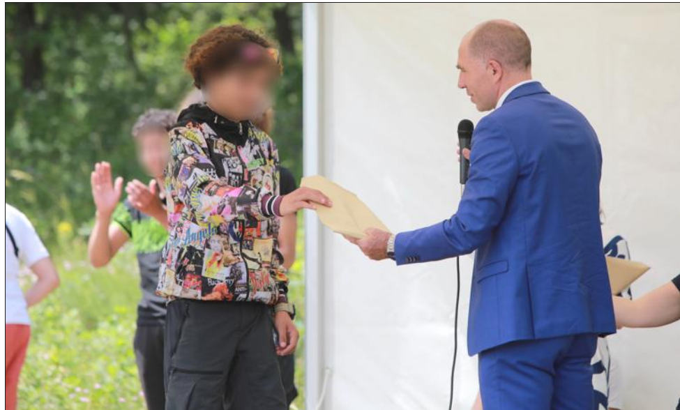
Le CER propose un accueil, un hébergement et un accompagnement éducatif pour six mineurs en rupture dans leur parcours de vie. Il met en place des programmes autour de la nature, du sport ou la citoyenneté et de l'acquisition de compétences, à raison de deux sessions de 20 semaines.

Cette journée portes ouvertes, au centre éducatif renforcé d'Aspres-sur-Buëch, marque le placement de ces six jeunes par la justice en alternative à la privation de liberté. Lors de deux sessions par an, pendant quatre mois et demi, des garçons de 13 à 18 ans viennent au domaine de Grange-Neuve pour un séjour de « remo-